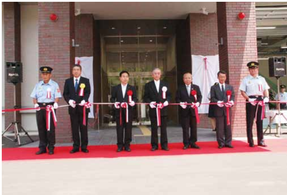
新消防庁舎落成式