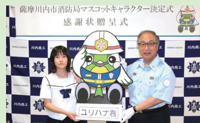
マスコットキャラクター決定式 (R4.5.26)