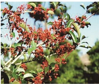
市木 クロガネモチ