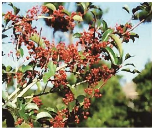
市木 クロガネモチ